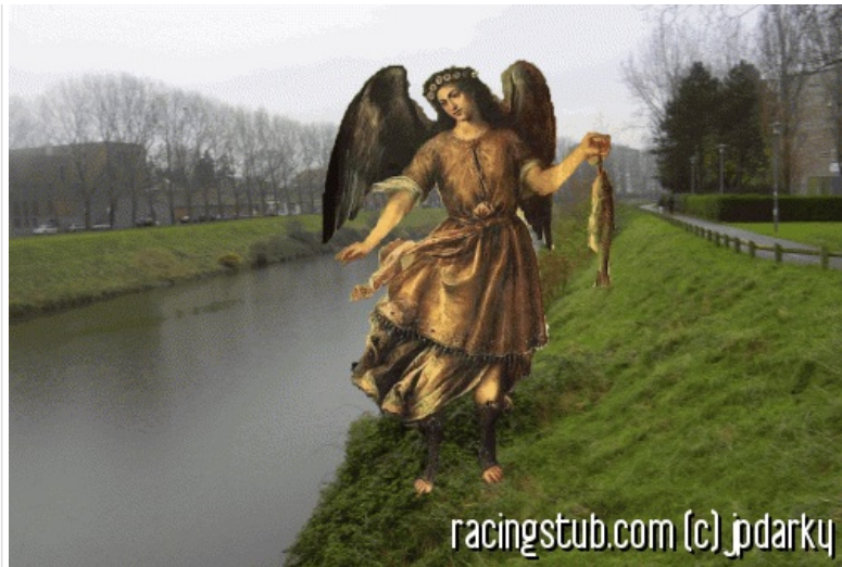
Saint Raphaël fait une belle prise à Dunkerque pour soigner les