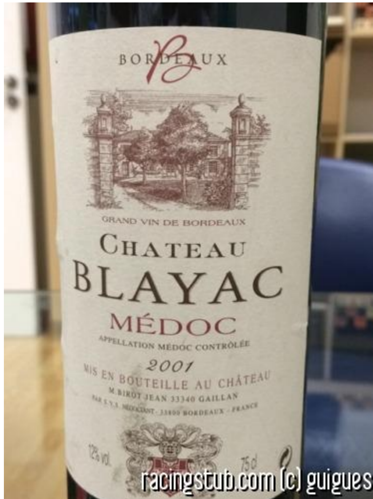
La seule photo de Blayac à notre disposition à ce jour

★★★★★ (4 notes) 📅 13/01/2015 05:00 ↻ Transferts © Lu 17.740 fois 👤 Par athor 🗨️ 8 comm.