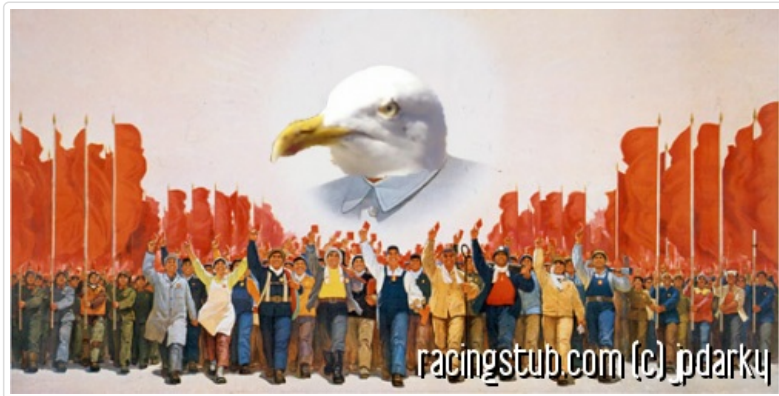
L'Empereur Pan-Galactique Mouette guide le peuple en liesse vers la Joie et l'Harmonie

La mouette dunkerquoise, dont vous avez pu suivre l'an passé les aventures contées semaine après semaine, qui a été l'objet de toutes les attentions de notre quatuor, mais pas seulement, est cet animal lumineux et volant, doté d'une intelligence hors du commun (hors de votre commun, bande de moules), ainsi que d'une forme de prescience qui le rend à nul autre pareil.