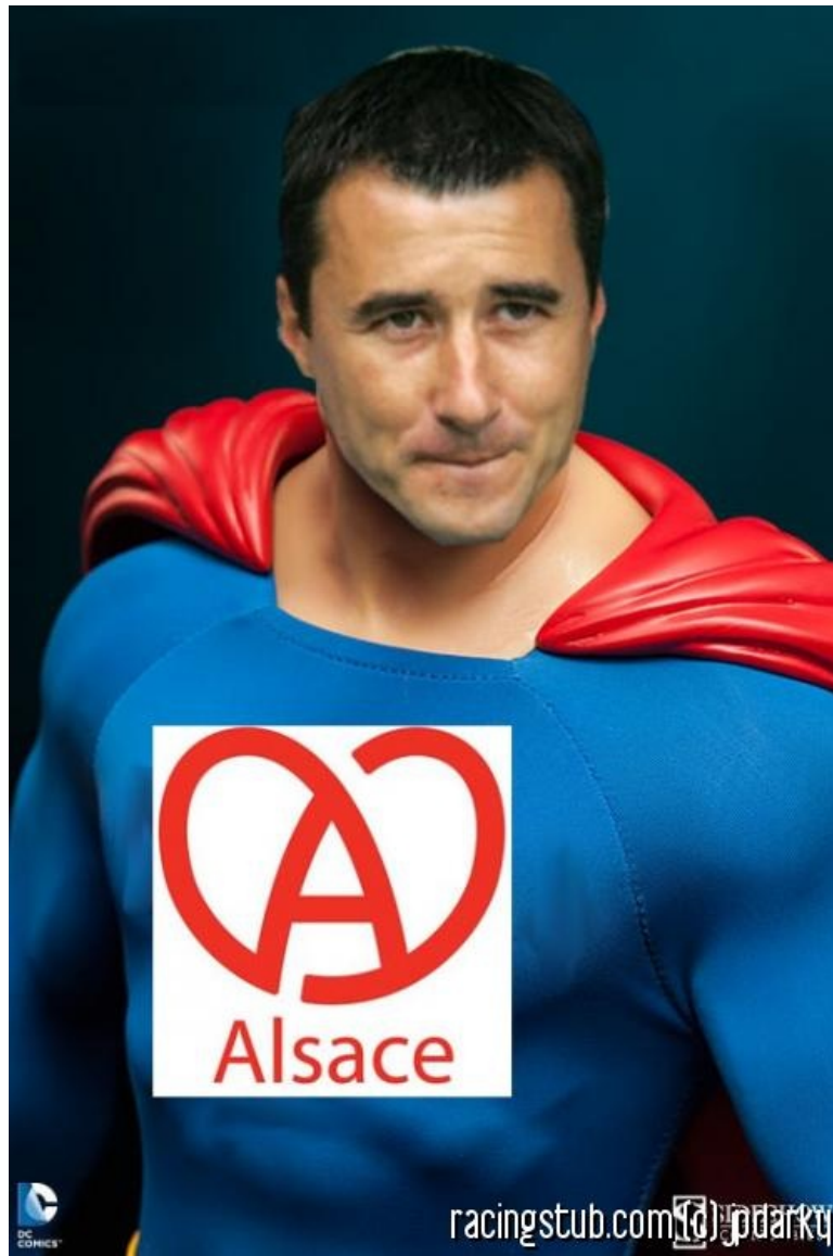
Notre Radioux et Clairvoyant Souverain Alsacien

★★★★★ (1 note) 📅 06/08/2015 05:00 🏏 Avant-match 🌐 Lu 5.488 fois 👤 Par jpdarky, meem 💬 8 comm.