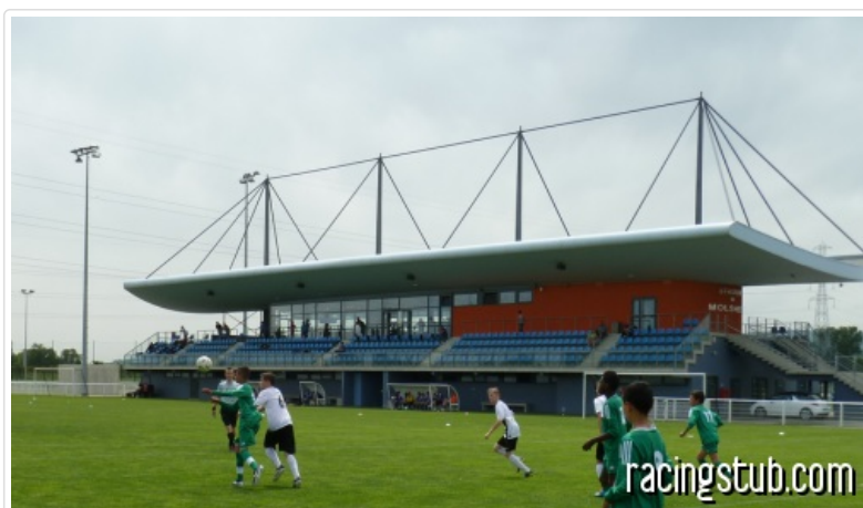
Le Stadium de Molsheim

Pour aller plus loin, le Racing souhaite maintenant restructurer totalement les espaces extérieurs. L'objectif est donc la construction d'un véritable complexe sportif, homologué pour accueillir des rencontres jusqu'en National 2, afin de faire jouer l'équipe réserve et toutes les autres catégories sur place. Celui-ci serait effectivement proche du modèle du Stadium de Molsheim, avec un bâtiment comprenant les locaux sportifs en rez-de-chaussée, deux tribunes de part et d'autre, orientées chacune vers un terrain, et un club-house central, vitré.