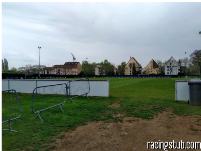
L'un des terrains d'entraînement actuels

★★★★★ (9 notes) 📅 17/04/2019 05:00 ↻ Au jour le jour ⌚ Lu 11.520 fois 👤 Par rédaction 💬 8 comm.