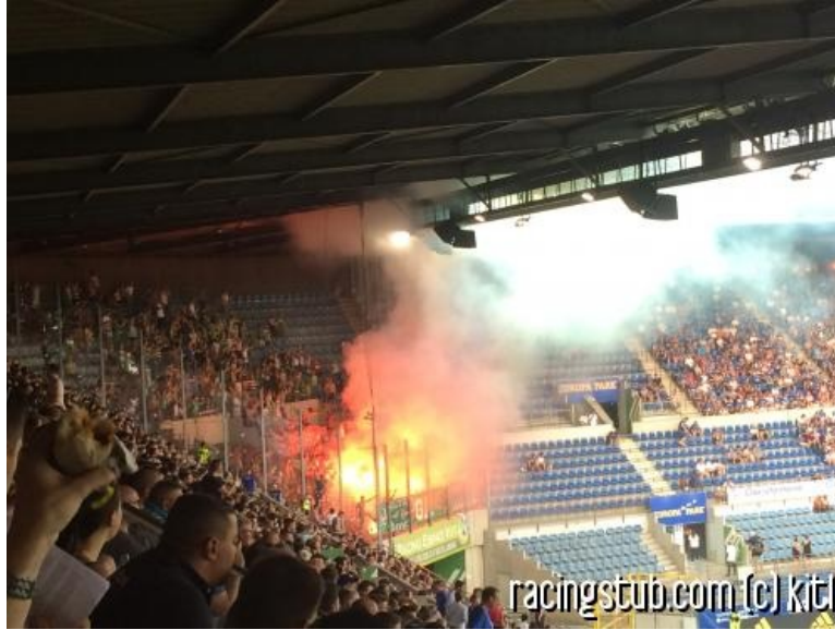
Les fans du Maccabi mettront la pression sur le Racing au match retour

★★★★★ (11 notes) 📅 01/08/2019 05:00 ↻ Avant-match 🌐 Lu 4.693 fois 👤 Par kitl 🗨️ 10 comm.