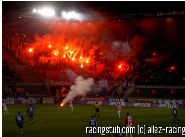
Les visiteurs surpasseront-ils les fans de l'Etoile rouge en 2005 ?

★★★★★ (7 notes) 📅 22/08/2019 05:00 📍 Avant-match 📖 Lu 5.483 fois 👤 Par kitl 🗨️ 4 comm.