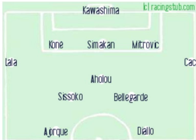
La composition probable

★★★★★ (1 note) 📅 22/11/2020 05:00 🏠 Avant-match 👁 Lu 3.390 fois 👤 Par prevost 🗨 2 comm.