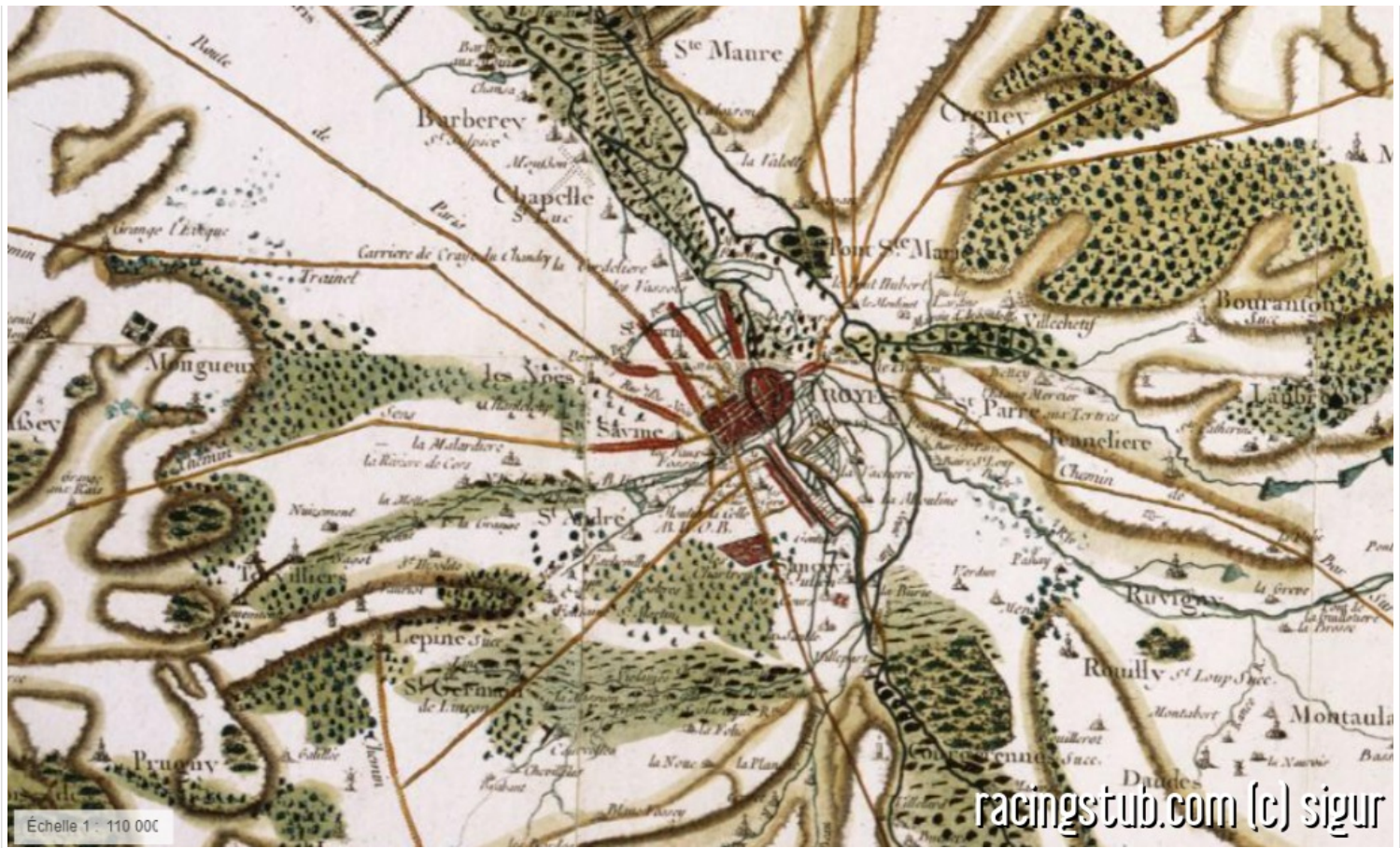
Troyes au XVIIIe, ça avait l'air bien

Il n'y a pas grand-chose à dire sur Troyes. La naissance de la ville est imputable à une tribu Celte et remonte à l'Antiquité. N'étant pas historien, je vous propose de faire un petit saut dans le temps. Durant l'entre-deux guerres, Troyes s'est spécialisé dans le textile (Petit Bateau, Lacoste et Dim y sont créés) mais dans les années 60, la concurrence asiatique et orientale plonge le secteur dans la crise. Voilà pour la partie historico-économique. Un peu faiblard pour alimenter vos discussions du repas de Pâques j'en conviens, mais en cette période électorale il est peu probable que l'histoire de la ville de Troyes soit un sujet de débat très prisé ce lundi. A la limite, vous pouvez tenter de caser que la spécialité culinaire à Troyes c'est l'andouillette, ça ne mange pas de pain.