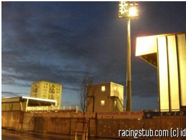
Lande bretonne, novembre 2006

☆☆☆☆ (0 note) 📅 20/08/2008 05:00 📍 Au jour le jour 🕒 Lu 2.701 fois 👤 Par zottel 💬 0 comm.