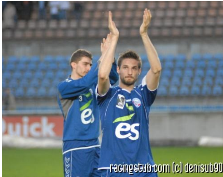
We will rock you

☆☆☆☆ (0 note) 📅 16/04/2011 05:00 📍 Avant-match 🕒 Lu 1.502 fois 👤 Par stroteam 💬 2 comm.