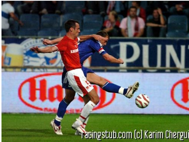
Pagis et le Racing, un dernier effort pour franchir l'obstacle.

☆☆☆☆ (0 note) 📅 29/09/2005 05:00 🏏 Avant-match 🌐 Lu 1.211 fois 👤 Par fremen-bleu 🗨️ 0 comm.